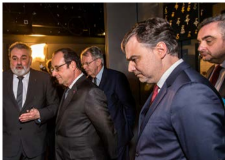
Visite de François HOLLANDE, Président de la République au Musée de la Franc-Maçonnerie le 27 février 2017

Le Grand Orient de France fonctionne sur un modèle démocratique. Ses loges sont souveraines. Les différentes fonctions (Grand Maître, Conseillers de l'Ordre, Présidents des loges...) sont toutes électives et encadrées sur le plan du cumul, du renouvellement et de la durée. Les loges sont représentées à l'Assemblée générale (le Convent) selon le principe « une loge, une voix ».