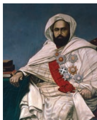
Emir ABD EL-KADER